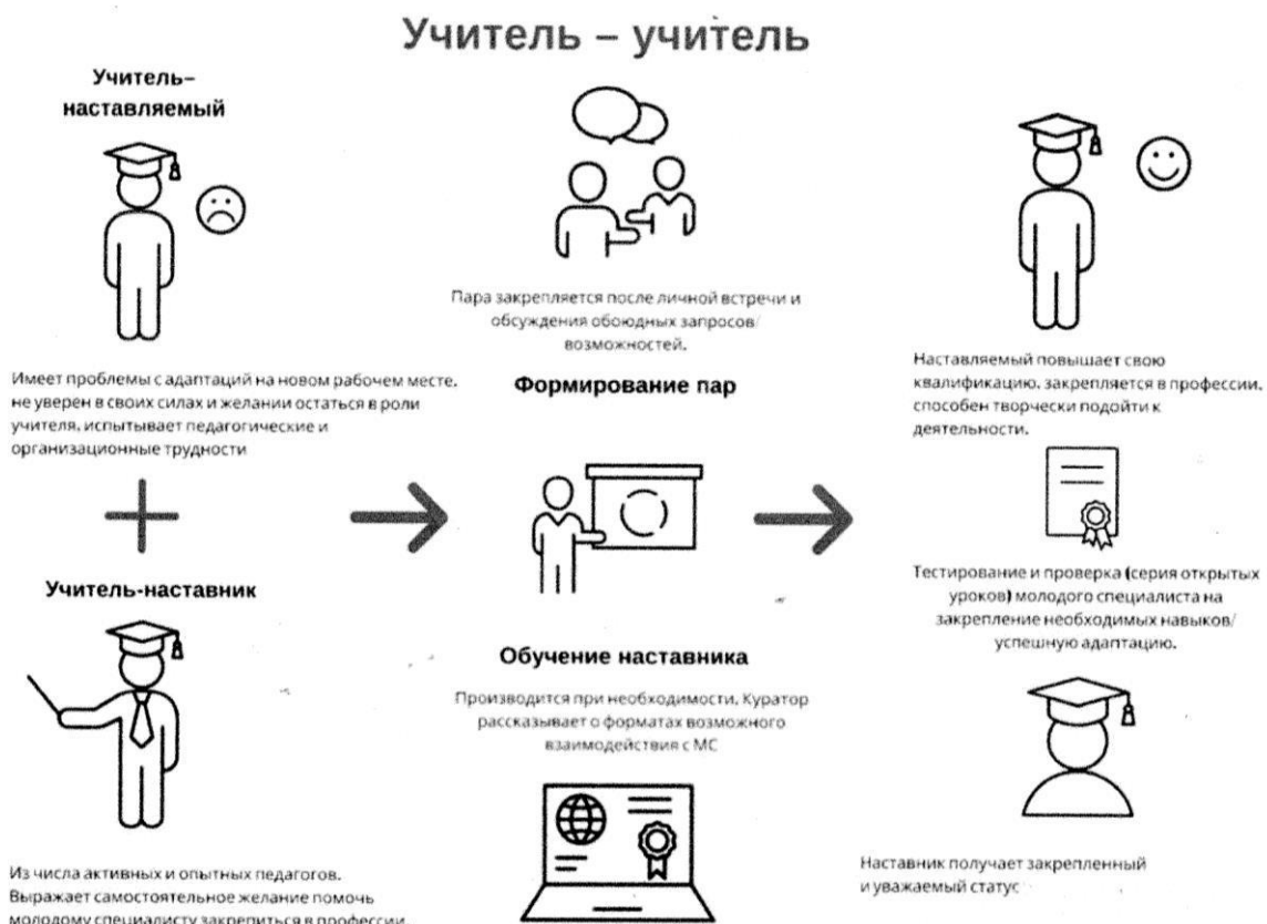
Рис.1 Форма наставничества «учитель – учитель»