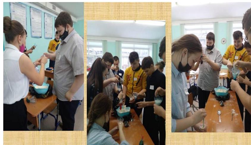
Клубная деятельность. «Антистресс»