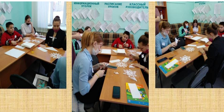
Клубная деятельность. Творческая мастерская «Символ года – снежинка».

Умение договариваться, понимать и оценивать различные точки зрения, обладать способностью воспринимать местные и глобальные проблемы, успешно и уважительно взаимодействовать с другими людьми, а также ответственно действовать для обеспечения устойчивого развития и коллективного благополучия это участие в разработках и проведения клубной деятельности в практике КСО