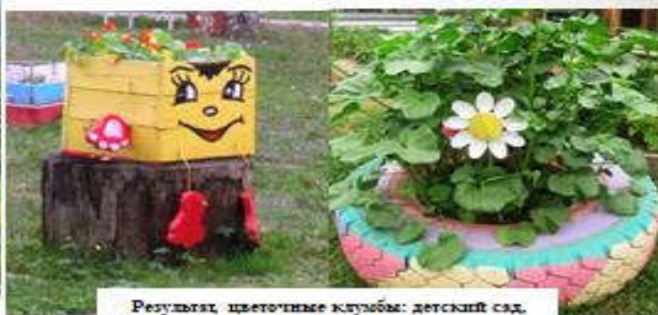
Результат, цветочные клубы: детский сад, территория почты.