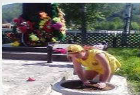
Высадка рассады цветов: парк В.О.В., детская площадка